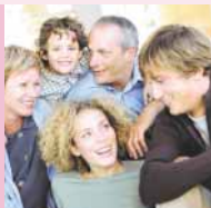
Famille W. Parents, enfants et petits enfants.

“ Je ne veux pas être une charge pour mes enfants. Je préfère leur faire bénéficier de mon patrimoine quoiqu'il arrive... C'est pourquoi j'ai souscrit à l'offre Vauban Autonomie. ”